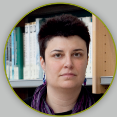
CASTILLO SUAREZ 38 URTE • ALTSASU

Egoera larrian dauden Ikastolak aurrera ateratzeko egiten den lan hau, etorkizunean gizarte euskaldun bat izateko eskubidearen aldarrikapena da, eta nire ustetan hori da Errigorak egiten duen ekarpen nagusia.