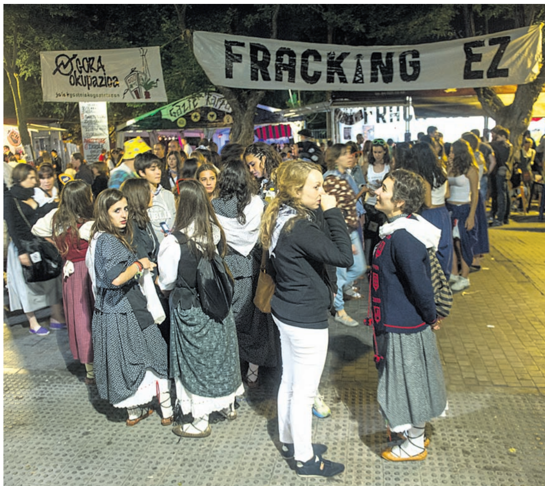
Gasteizko txosnagunea, iaizko jaietan. Aurrean, kide berri bat gehitu da: «Ateneo» aldizkariak txosna jarriko du lehenbizikoz.

Ez da meritu makala horrelako gune askeetan, laguntzarik gabe egiten diren eskaintzak egitea. Kontzertuen aldetik, puntako taldeak aritu izan dira beti Gasteizko txosnaguneko taula gainean, eta aurrean ere hala izango da. Gaur, adibidez, Vendetta nafarrak arituko dira Xeic! eta Big Band Berrirekin batera. Bihar, preso eta iheslarien egunean, berriz, Inoren Ero Ni, eta Tximelleta izango dira protagonistak. Gaur iristean, Las Tea Party DJ's sona handiko bikoteak dantzan jarriko ditu bertaratutakoak, Euskal Herriko beste hamaika jaietan egin duten bezala.