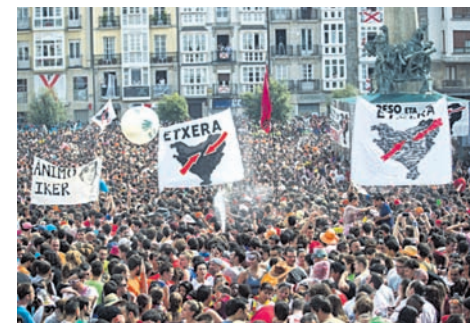
Iazko txupinazoaren irudia.