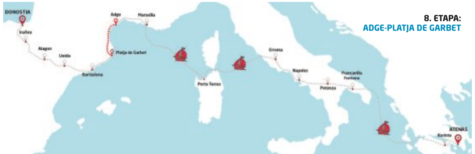
8. ETAPA: ADGE-PLATJA DE GARBET