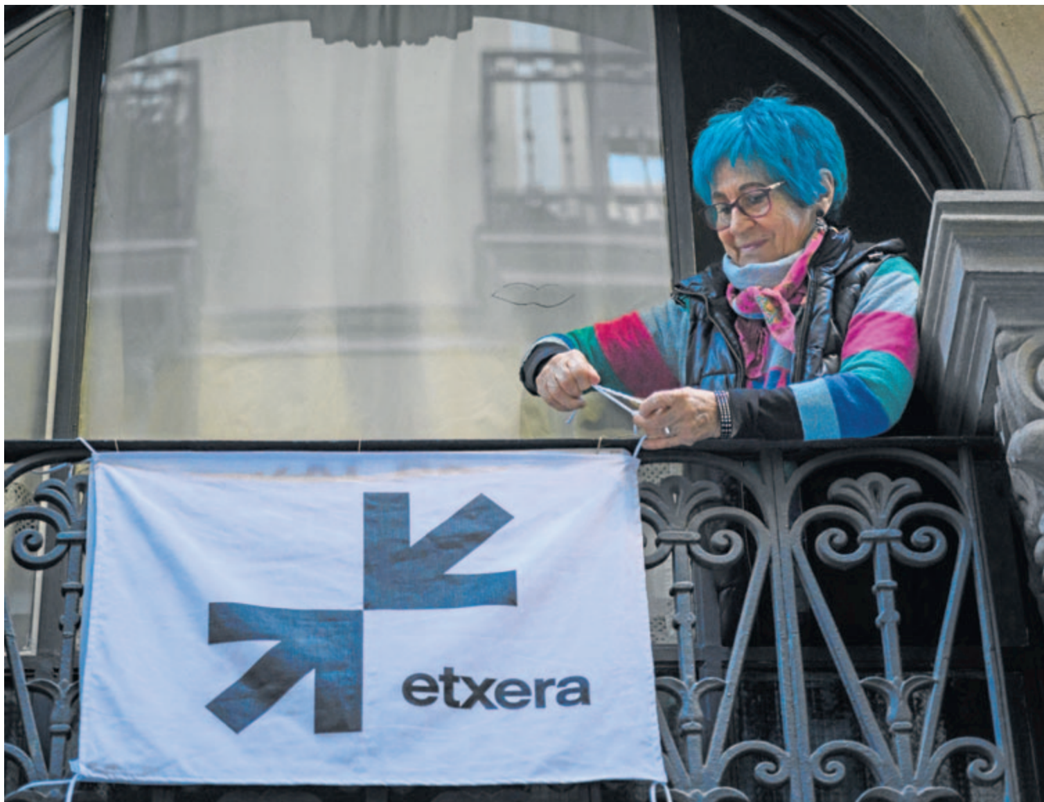
Una mujer coloca en su casa de Bilbo la nueva banderola por el regreso a casa de los presos.