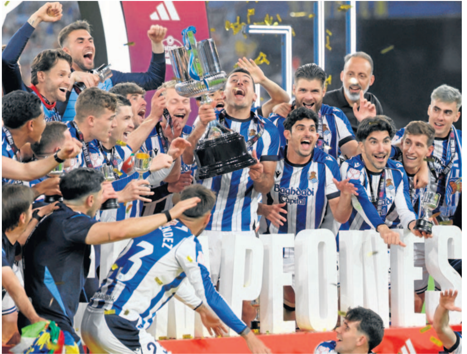
El capitán de la Real Sociedad, Mikel Oyarzabal, y el resto de jugadores con la Copa.

IGANDEA XXVIII. urtea | 9.855. zk. 3,00 euro