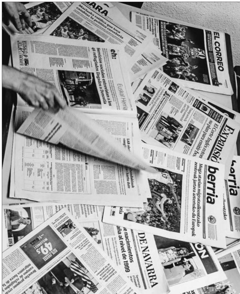
Garai batean egunkariak irensten genituen.

Eta hori ez da albiste ona. Ez komunikabideentzat, ez herritarrentzat. Hedabide eta kazetari profesionalak behar ditugu botere guztien jarduna kontrolatu dezaten, abusuak ikertuz, pertsonen arazoak bistararaziz, eta ez bakarrik prentsa bulegoetan botereak sortutako berriak argitaratuz. Alegia, beren eginkizuna hitzez hitz hartuz, pantailaratu den egunerokoan betiko irakurleak eta irakurle berriak pantailaz pantaila bereganatuz! •