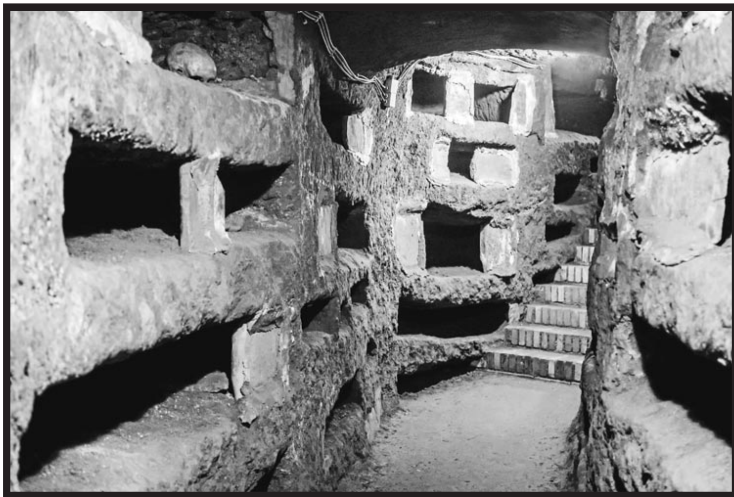
750.000 hilobi baino gehiago pilatzen dira Erromako katakonbetan, 170 kilometroko hedapena duten lurpeko tuneletan zehar.

Pasabide horiek induskatu zituzten esklabo askoren bizitzak bertan amaitu ziren, baita erabateko iluntasunean inoiz irtenbiderik aurkitu ez zuten askoren bizitzak ere