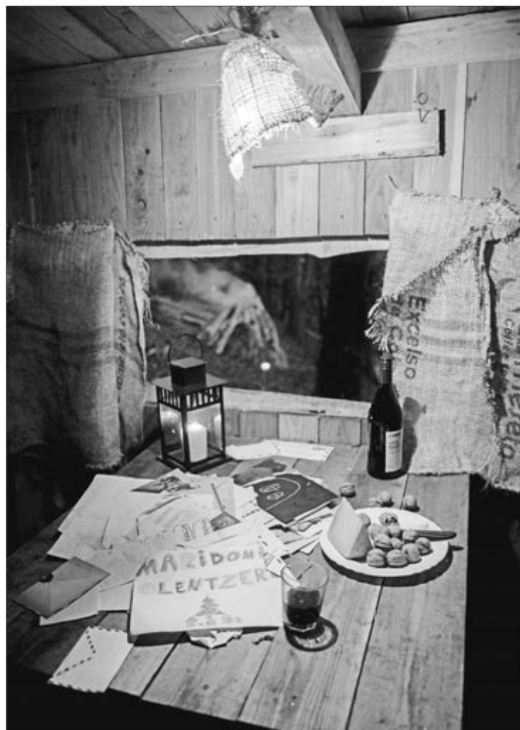
Saiatu bizi dituzun gabonez gozatzeko.

Gabonak ez dira kosta ahala kosta zoriontsu izatera behartzeko garaia. Elkar ulertzeko, zaintzeko eta ahalik eta ondoen egokitze modua bilatzeko garaia da. •