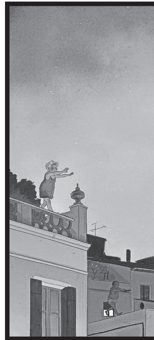
Ilustrazioak: MAI EGURZA

Txikitatik izan du Egurzak marrazkigintzarako zaletasuna, ilustratzaile izatera iritsi artekoa. Gutxi izango dira ilustrazioak egitetik bizi direnak, baina berak argi zuen behin derrigorrezko ikasketak amaituta zer ikasi nahi zuen: «Ez nuen beste aukerarik ikusten. Txikitatik gustatu izan zait marraztea –jarraitu du–, nahiz eta ez nuen nire ogibidea izango zela pentsatzen. Gustura marrazten nuen, etorkizunaz asko kezkatu gabe».