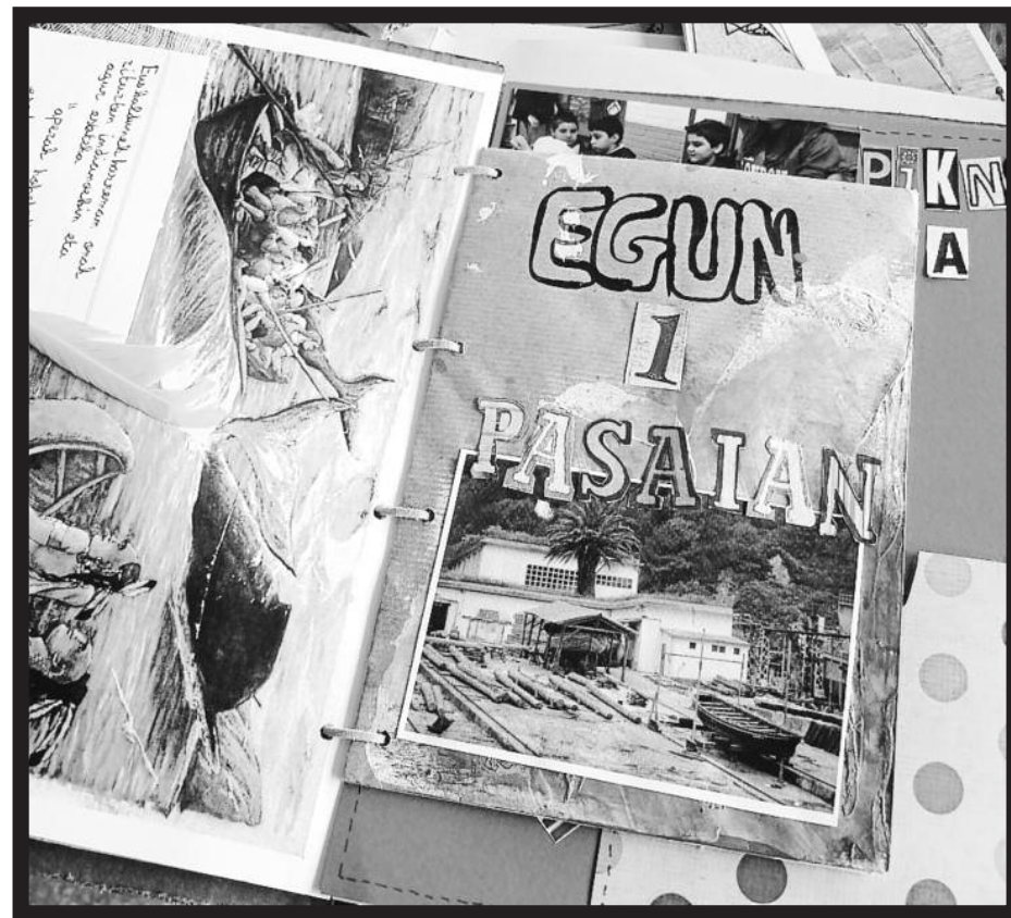
Maiatzaren 21ean bukatu zuten «Baleontziaren bidea». Goian, XVI. mendeko gertakariak kontatuz Donibane Lohizuneko Jai Alai pilotalekuan eskainitako ikuskizuna. Eskuinean, lau urteko «bidaian» bizitakoarekin ikasle bakoitzak osatu duen oroitzapen liburuxkaren orri bat. LARZABAL kolegioa

nen itsasoratze egunean hain zuzen, eta bukatzeaz bat estreinako bidaian Donibane Lohizunera etortzea. Borobila. Horrexek liluratu zituen gehien seigarren mailan proiektua aurkeztu zitzaizenean.