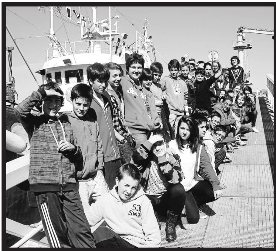
Goian, «kortsarioen pare» altxorraren bila Donibane Lohizuneko kale bihurrietan ibili zirenekoa. Ezkerrean, Biologia maisu berezitik, Mater atunontzitik, jaitsi zirenean. LARZABAL kolegioa