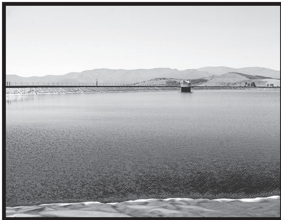
Karrantzako Cerroja baltsa, artxiboko irudi batean.

Karrantzako udal gobernu taldeak ere erantzun berdina aurkitu du.