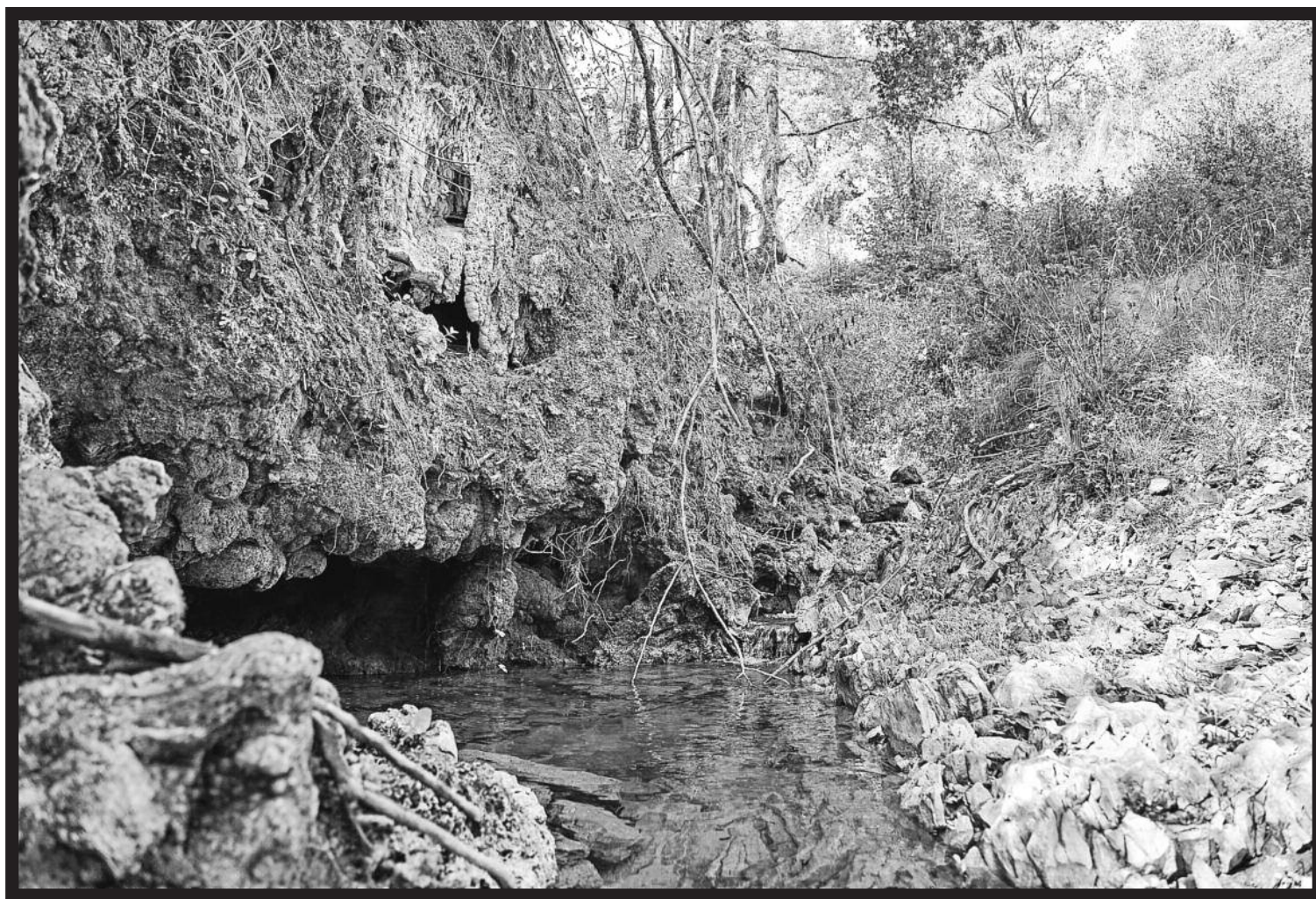
Ondoko orrialdeko irudian, hoditeriak Gernikan. Lerro hauen gainekoan, Ea herriko Ulla hargunea.

Defizit hidriko horren atzean hamarkadetako utzikeria eta inbertsiorik ez historikoa egon da. «Gure baliabide hi-