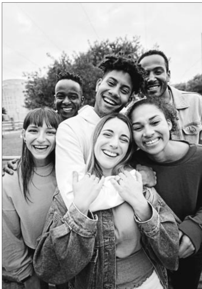
Lagunarteko harremanak oso onuragarriak dira.

Beraz, gure ongizatean bitartekari izateko, ona da eguneroko kontaktu sozial atsegin horiei guztiei bere lekua ematea. Elkarrizketa laburrak, eguna nola doakizun bezalakoak, beti aberasten gaituzte. Eta horrelako "loturak", lagun onak bezala, landu eta sustatu beharko genituzke gure zimurrak urtez eta gozatutako esperientziez bete arte. •