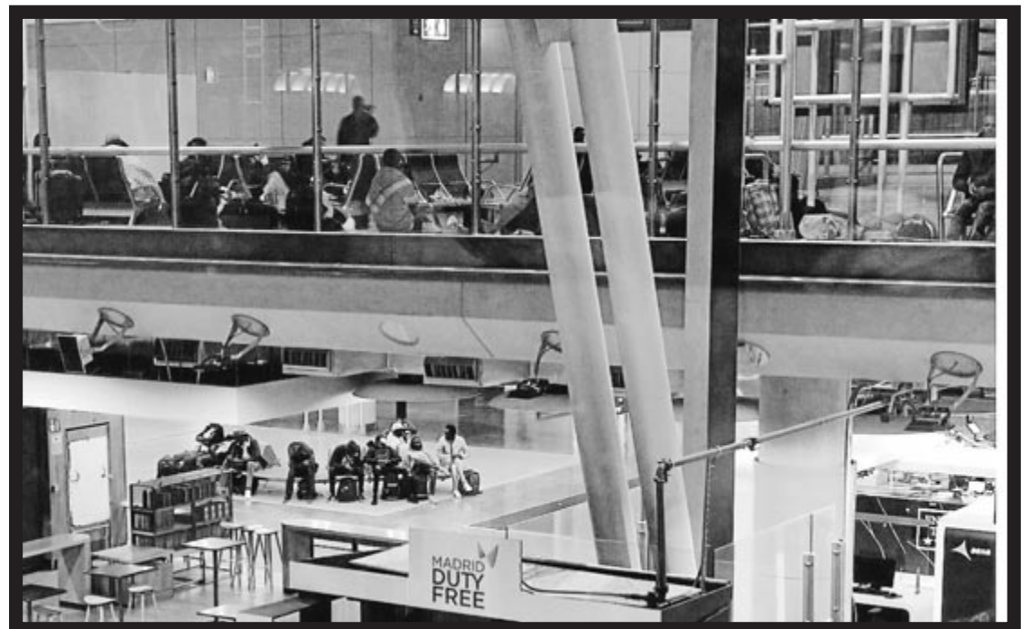
Barajaseko aireportuko geldiune-eremu bat asilo eskatzaillez gainezka. EP