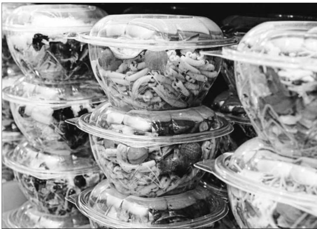
Elikagaiak alferrik ez galtzeko aplikazio gero eta gehiago daude.

Beraz, batetik, elikagaien kudeaketan etorkizun iraunkorragoa lortzeko aukera izan daitezke aplikazio hauek, eta hondakinak murrizteko duten garrantzia agertu dezakete, baina bestetik, horien eraginkortasuna kontsumo-ohiturak barneratzeko moduaren arabera da neurri handi batean. Funtsezkoa da erabiltzaileek beren zeregina ulertzea, prezio merkeko produktuak eroste hutsetik harago, kontsumo arduratsua sustatzeko erantzukizuna aitortuz. •