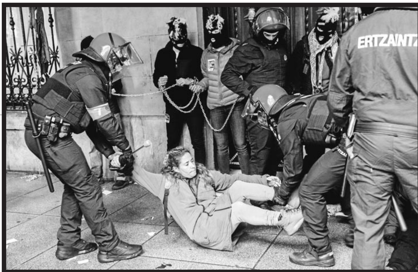
Goiko irudian, pasa den azaroaren 30eko Greba Feminista Orokorrean, Ertzaintza protestan ari zen emakume bat lurretik altxatzen.

Gaien hautaketari dago-kionez, «saiatu gara kontsekuenteak izaten gure filosofia ehuntzen duten hiru hariekin», azaldu dute. Kolektibotasuna, desmuntatu beharreko poliedroaren aurpegi desberdinak eta 'bizitza