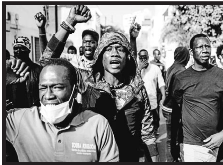
Txalupa bat, gau beltzean, itsasoan galduta. Ondoko irudian protestak Dakarren, Senegalgo hiriburuan.

Eta, agian, tramite horrek errealitatearekin aurrez aurre jarri ditu.