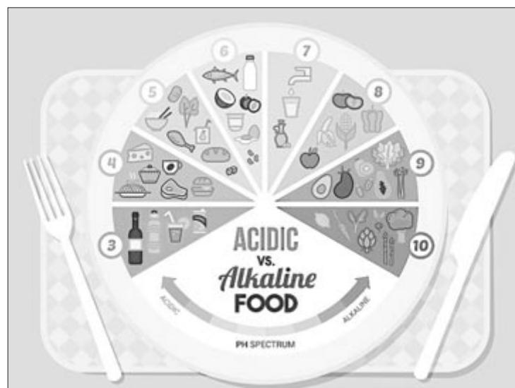
Elikagaien sailkapena, haien pH azidoaren arabera.

Garunaren erabileran kontziente izan gaitzen, zelulen funtzionamendu zuzena ezinbestekoa da, eta horretan, odolaren jarioa inplikaturik dago. Miraririk ez dago, baina gure garunaren elikatze kontziente bat izan behar dugu, elikagaien aldetik noski, baina bizipen jatorrez, osasuntsuz eta emozio egokiz kudeatuta. Hona hemen bost gomendio garunaren elikatze osasuntsu baterako: ibili naturan, eguzkia hartu, elikadura ekologikoa eta osasuntsua izan, ez izan beldurrik, eta, neurri handi batean, sare sozial eta teknologietatik deskonektatu (mugikor, TV, sare sozialak). Hau bai dela garuna ideologikoki elikatzea, kontzientzia haren funtzionamenduan oinarritzen bada. •