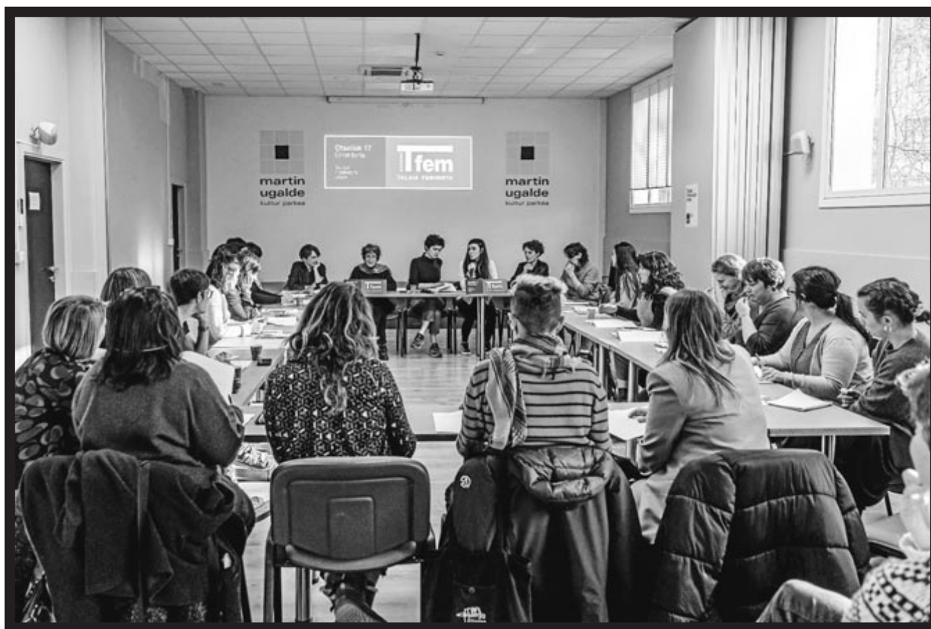
Duela aste batzuk aurkeztu zuten Talaia Feministaren 2023ko behin-behineko txostena.

Prozesuan parte hartzen ari den Jule Goikoetxearen hitzetan, «gutxitan egon naiz horrelako prozesu batean, non 25-30 emakume elkarrekin diren maiztasun batekin sakoneko gai ideologikoak aztertzeko. Mugimendu feministaren ekarpenari begiratzean, ez da bakarrik arreta jarri behar helburuetan, baizik eta prozesuan. Gure kasuan, subalternoak direnen