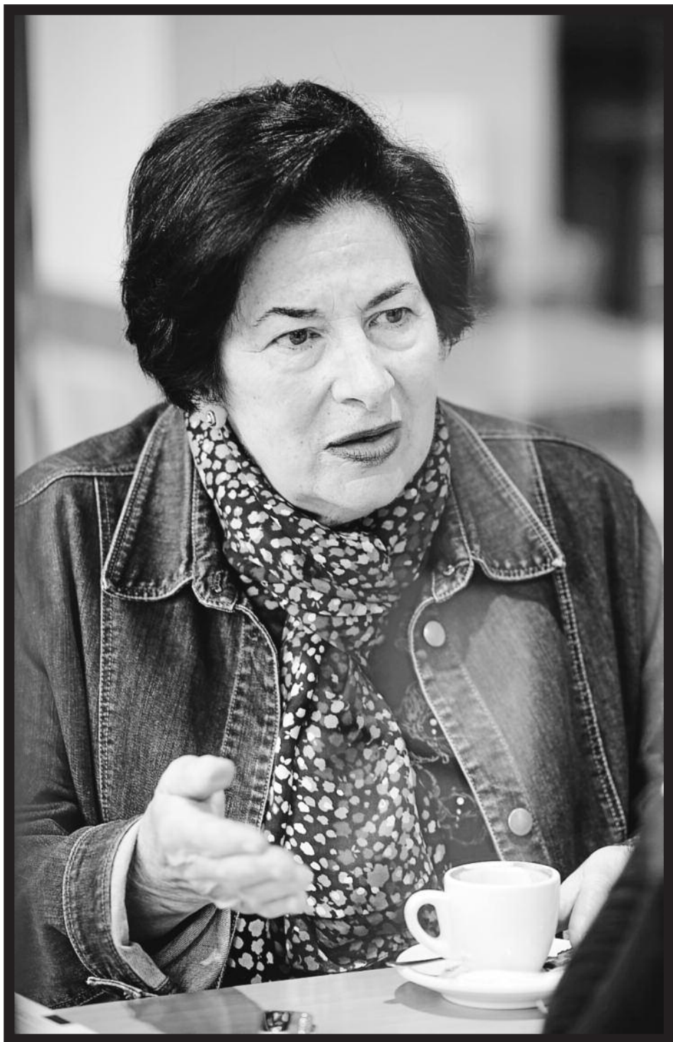
Andoni CANELLADA | ARGAZKI PRESS