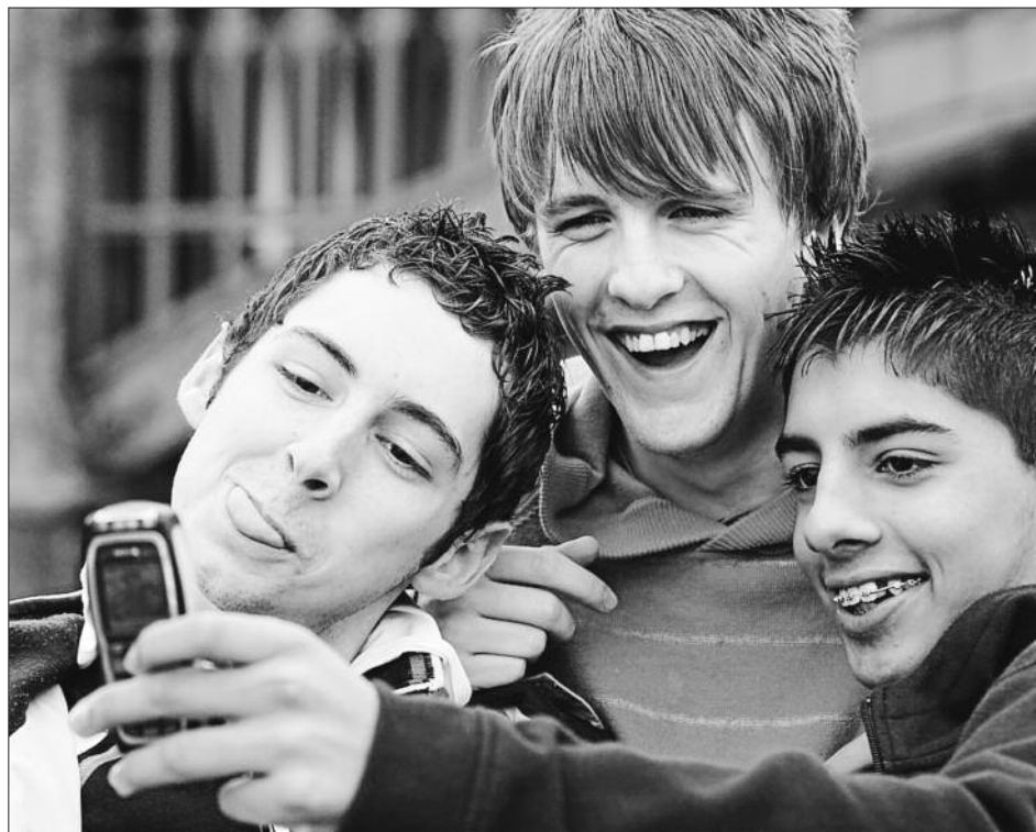
Gaztetxoek aisialdiko eta komunikazioko elementu nagusi bihurtu da smartphonea. GAUR8

Horretarako, ordea, guraso edo hezitzaileak eredu izan behar du. Eta askotan sumatzen dut, hain justu, norberaren jarreraren gaineko hausnarketa hori falta dela, kezka osoa seme-alabengan proiektatuz. Eta, izan, eredu izatea da besteei mugak erakusteko biderik eraginkorrenetako bat. •