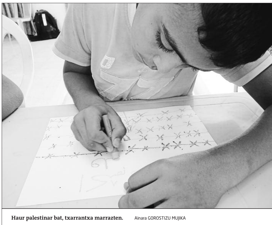
Haur palestinar bat, txarrantxa marrazten.

Zenbat eta zenbat haur eta gazterentzat hasten ote den mundua txarrantxaren beste aldean. Zenbat eta zenbat haur ote dauden txarrantxaren beste aldetik munduari begira. •