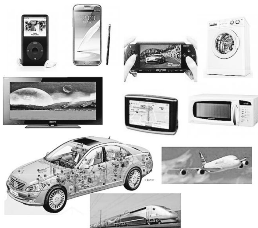
Ordenagailu ikusezinez inguratuta gaude. GAUR8

Gero, lantokira edo eskolara joateko automobila, autobusa edo trena hartu baldin badugu, horietan, mikrokontrolagailu bakarra ez, ehunka daude: ateak automatikoki ireki eta ixteko; motorra pizteko sistema elektronikoa; erregairen kontsumoa kontrolatzeko; motorren kutsatze maila kontrolatzeko sistema, softwarea barne... •