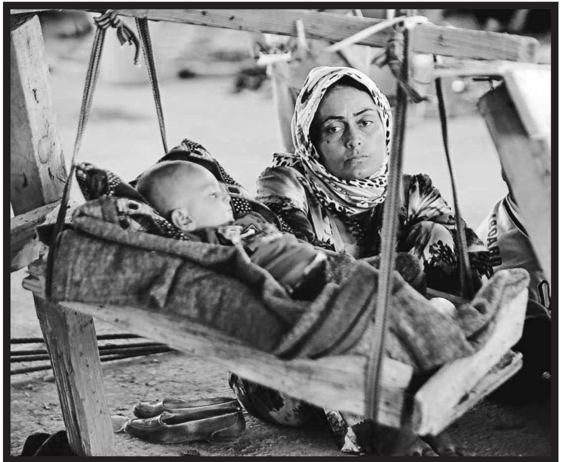
Emakume yezidi bat bere haurra zaintzen, Estatu Islamikoaren atzaparretatik ihes egin ostean.

2014ko abuztuaren 3an, jihadistek 5.000 gizonetako inguru erail eta 7.000 emakume eta haur bahitu zituzten Sinjar yezidien gotorleku historikoan. Estatu Islamikoak azken mendeotan yezidien babesleku izandako Sinjar guztiz suntsitu zuen. 200.000 lagunek ihes egin behar izan zuten, eta milaka per-