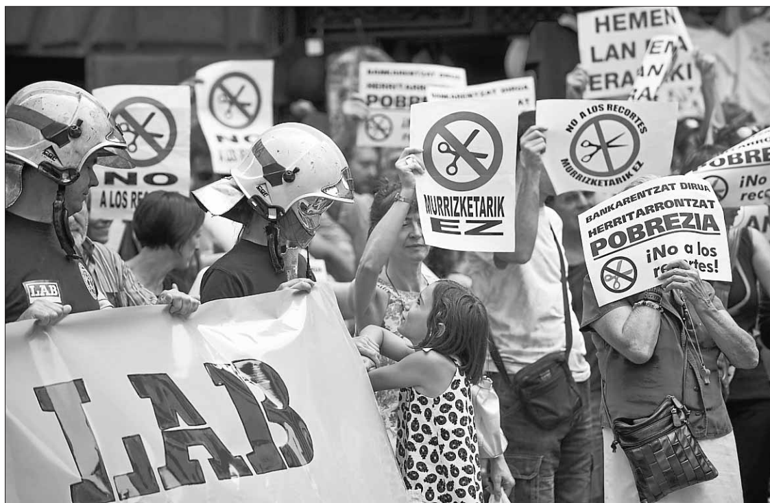
Protesta en Iruñea de LAB en contra de los recortes de Madrid y los gobiernos autonómicos.