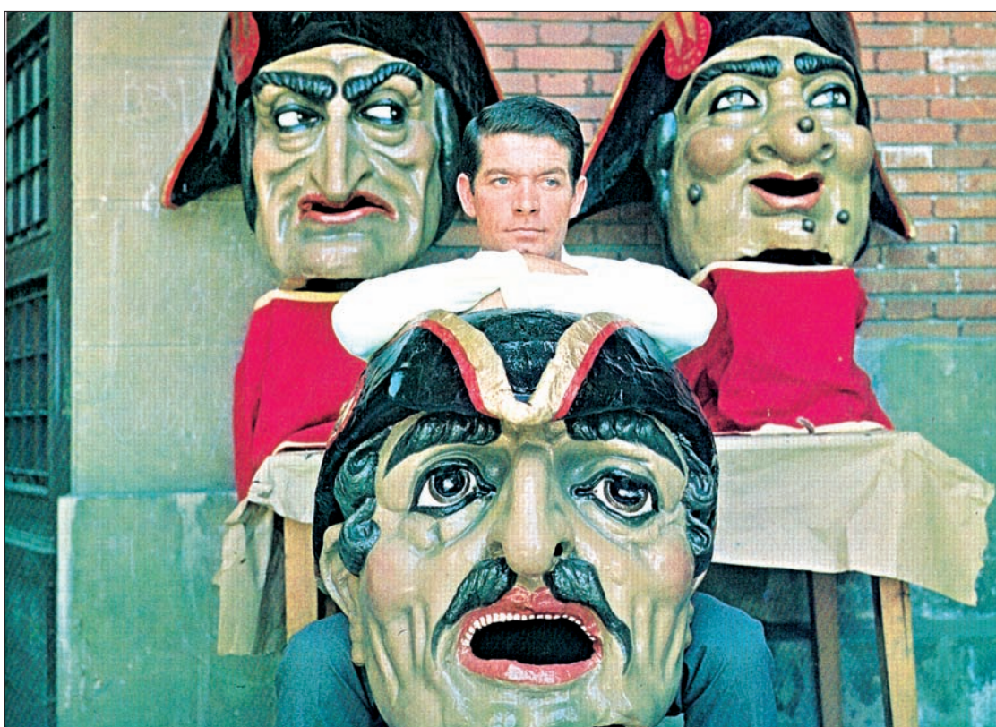
Caravinagre fue incluido en los carteles promocionales de «Carnaval de ladrones», en 1967.