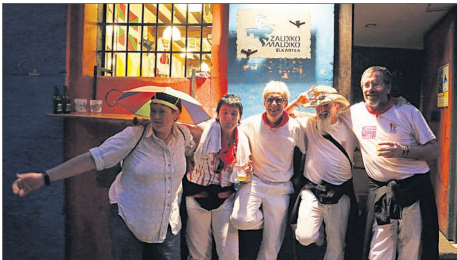
Los bares podrán permanecer abiertos hasta las seis de la mañana.