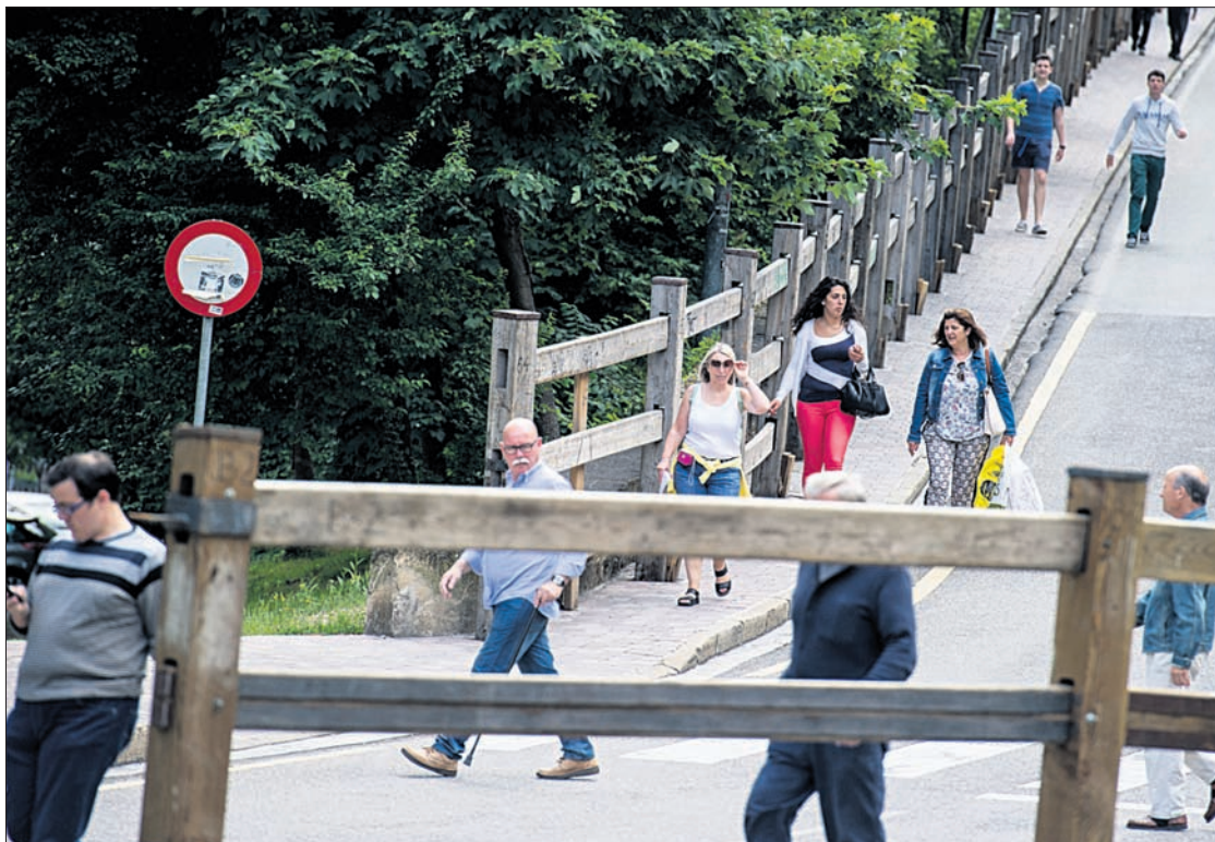
Vallado para el encierrillo, colocado entre los corrales del Gas y los de Santo Domingo.

Por supuesto, durante el encierrillo está prohibido citar a los toros, e incluso utilizar flash fotográfico. Lejos quedan los tiempos en que los mozos hostigaban a los animales durante su traslado hasta los corrales de Errotxapea, a modo de diversión. De hecho, hasta