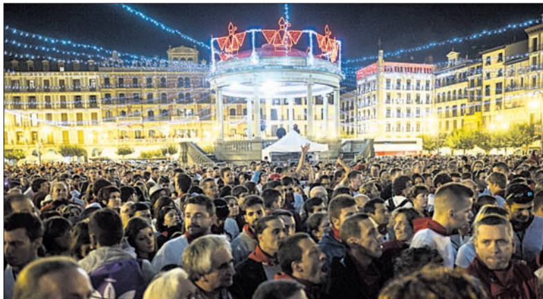
La Plaza del Castillo en uno de los conciertos de 2014.

Con el propósito de hacer bailar y transformar la Plaza del Castillo en una gran discoteca, actuará el día 11 la Fundación Toni Manero. Como su nombre indica, 7 Décadas ofrecerá el día 12 un show con 101 versiones de los grandes éxitos del pop, rock, blues, reegae, movida madrileña, techno, dance y música yé-yé de los últimos 70 años.