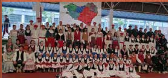
Aritz Berri Dantza Taldea (25 urteurrena / aniversario)