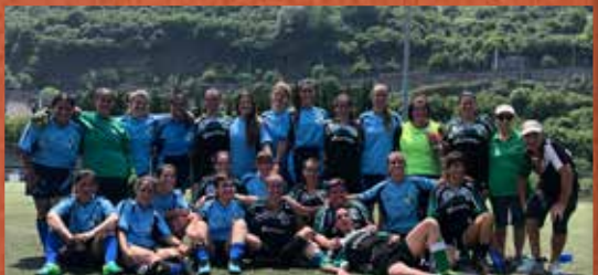
C.D. Adiskideak Ollargan (40 urteurrena / aniversario)