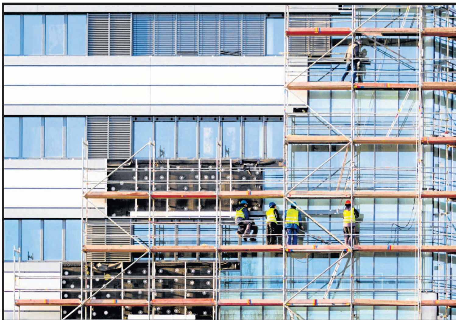
Tanto en el exterior como en el interior es importante utilizar aislantes térmicos que puedan impedir la propagación del fuego. GARA

Así, sostienen que aislar una vivienda con celulosa la protege perfectamente contra el fuego, ya que aunque en su fabricación se emplea papel de periódico, también se le añaden sales de boro que hacen que el resultado final dé como resultado un material aislante térmico que, además, evita la propagación del fuego, sin ge-