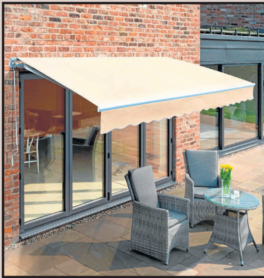
En el caso de terrazas, el elemento más demandado es el toldo extensible. GARA

Y para protegernos de un sol excesivo o del xirimiri, nunca está