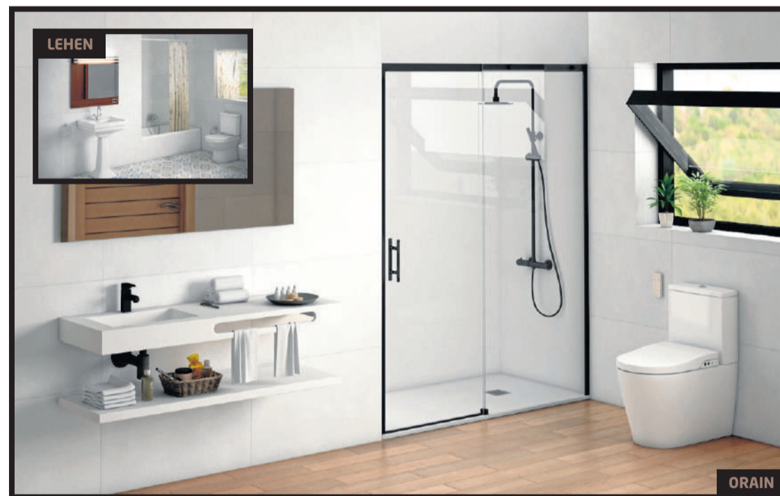
Dutxa jartzeko orduan, bezeroak hobekien egokitzen den aukera eska dezake. GARA

Proiektu bakoitzak irtenbide bakar eta desberdin bati